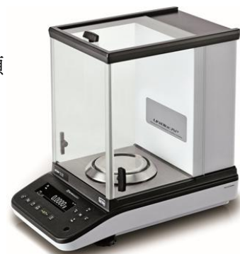
実習で使用予定の分析天びん