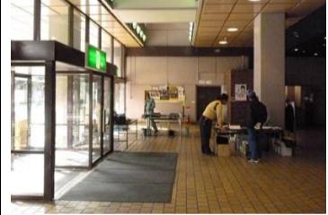
〔市民会館のロビー〕*快適!