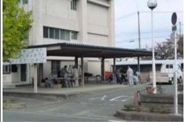
〔駐輪場〕*風雨に苦勞