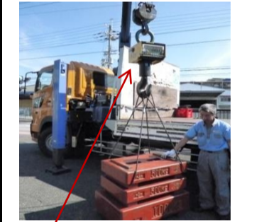
〔デジタル懸垂式はかり〕*10t