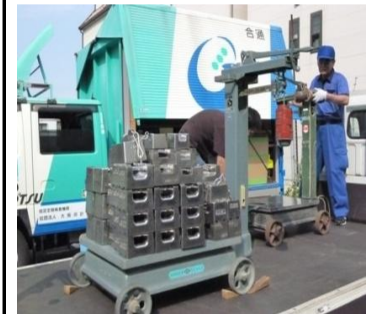
〔不等比台手動はかり〕*ひょう量750kg