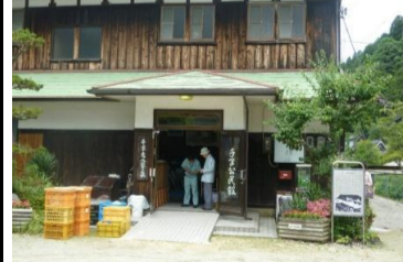
〔初夏〕*緑があざやか(千早赤阪村)