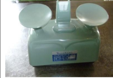
〔等比皿手動はかり〕