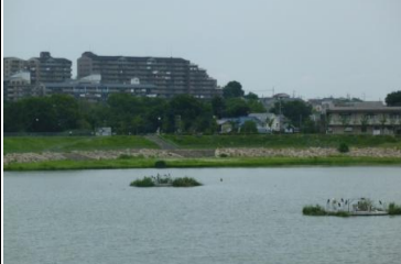
〔狭山池〕*大阪狭山市