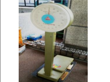
〔ばね式台指示はかり〕*体重計