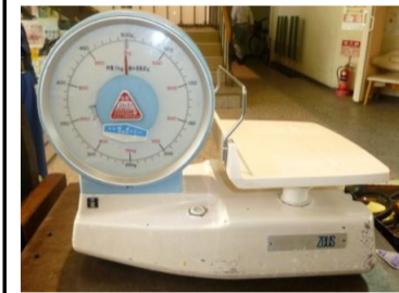
〔ばね式皿指示はかり〕*多回転式