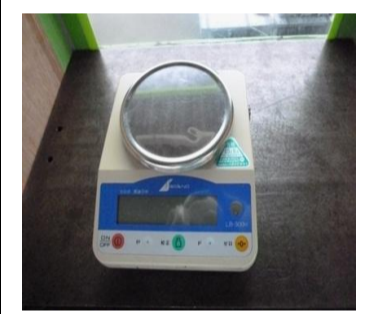
〔電気式はかり〕*音叉式(M級)