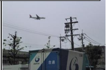
〔空港の近く〕*豊中市