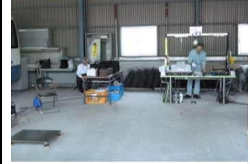
〔車庫〕*広くて検査しやすい