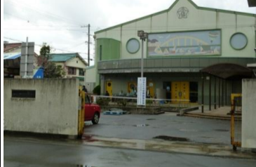
〔晩秋〕*時雨で寒かった