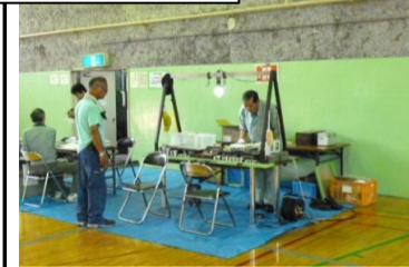
〔体育館〕*蒸し暑かった