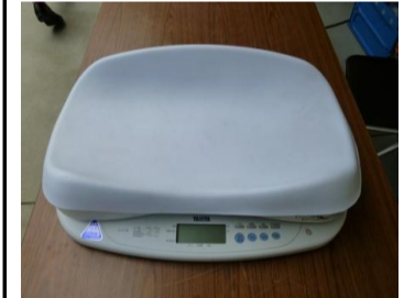
〔ベビースケール〕*電気抵抗線式