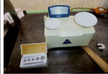
〔手動指示併用はかり〕