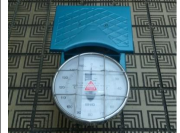
〔ばね式台指示はかり〕*体重計