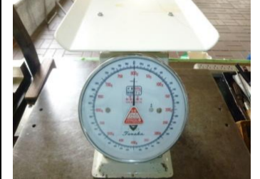
〔ばね式皿指示はかり〕