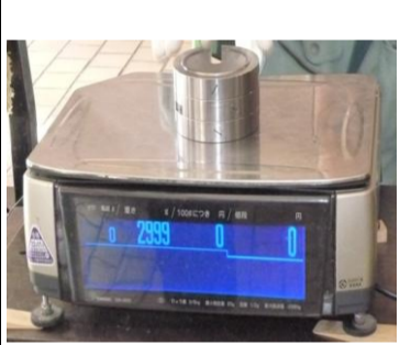
〔電気式はかり〕*電気抵抗線式(M級)