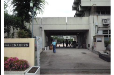
〔小学校の構内〕*安全面で児童にきづかう