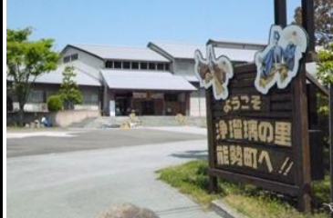
〔浄るりセンター〕*能勢町