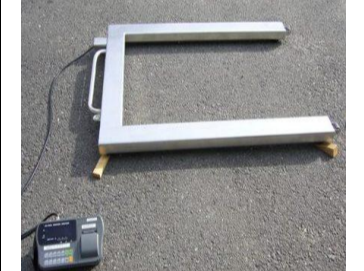
〔パースケール〕*電気抵抗線式(1.5t)