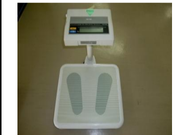
〔デジタル式体重計〕*電気抵抗線式