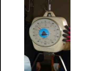
〔ばね式皿指示はかり〕*懸垂式