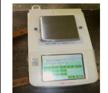
〔電気式はかり〕*電磁式(II級)