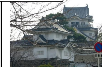
〔春〕*桜の花がちらほら (岸和田城)