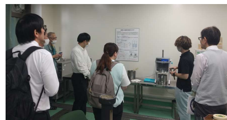
血圧・温度検査室