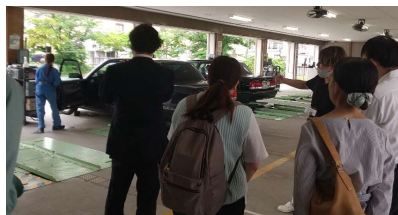
タクシーメーター装置検査場