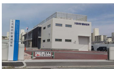
大阪府計量検定所