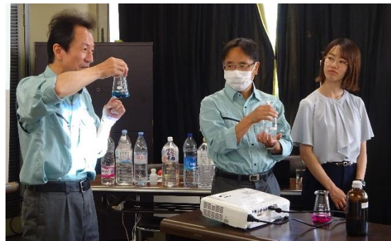
水の硬度に関する講義