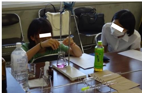
水の硬度測定の実験