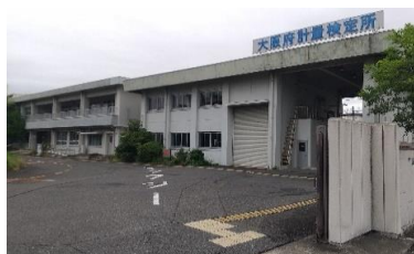
大阪府計量検定所