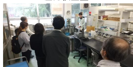
血圧・温度検査室