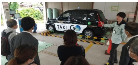
タクシーメーター装置検査場