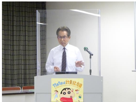
「計量法の概論及び最近の動向」