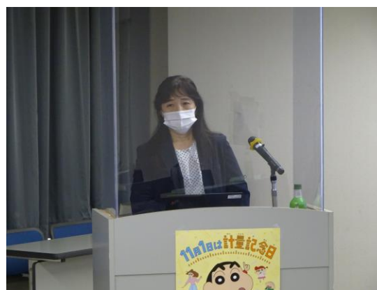
「生産部門における計量管理の実務」