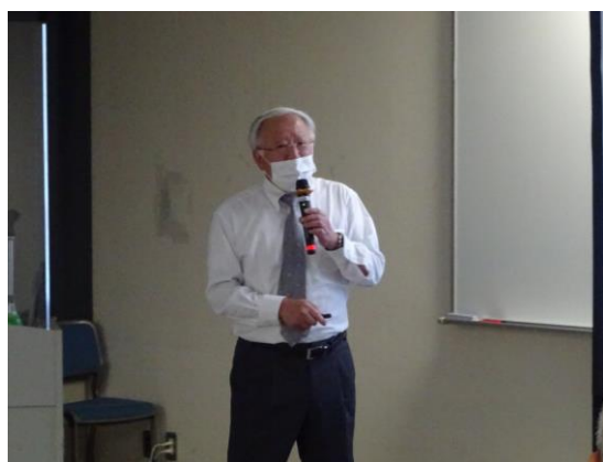
「計量法の概論及び最近の動向」