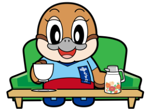
不要不急の外出自粛