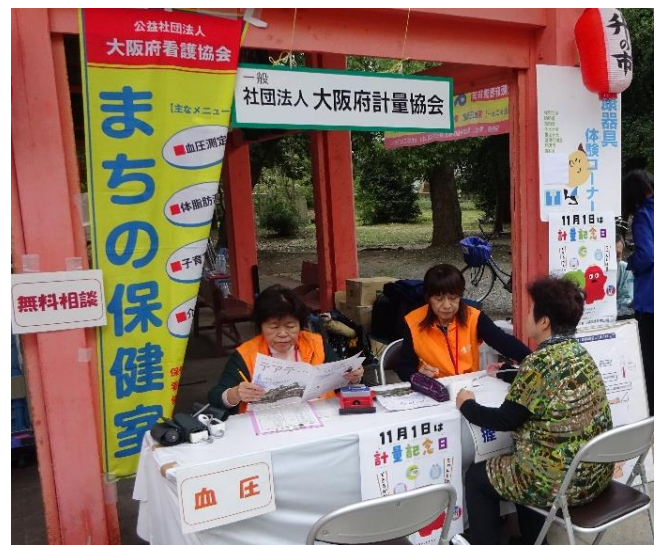
健康相談コーナー (公益社団法人大阪府看護協会)