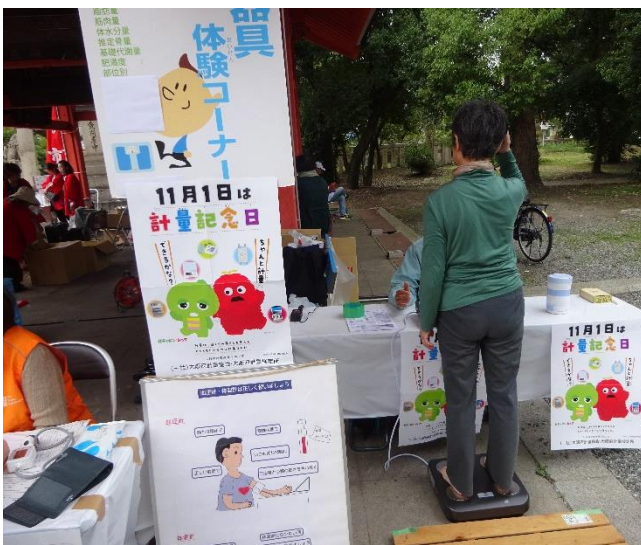
体組成計による測定コーナー (一般社団法人大阪府計量協会)

大阪府計量協会も大阪府看護協会の協力を得て、体組成計測定コーナー、パネル展示及び健康相談コーナーなどのイベントを開催いたしました。