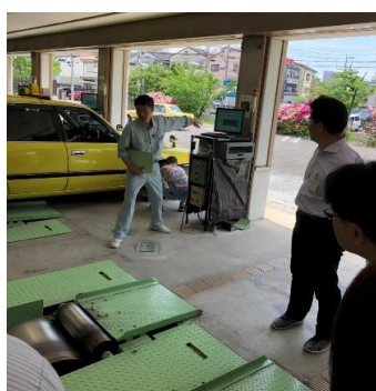
タクシーメーター走行検査場