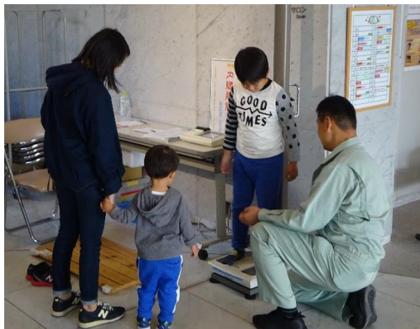
体組成計測定コーナー