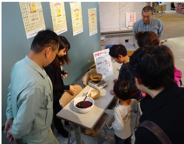
計量チャレンジコーナー

大阪府計量協会は、大阪府計量検定所との共催で、「くらしと計量展」のコーナーを設け、あずきを使用した計量チャレンジ、体組成計測定及び天びんキットの作製等のイベントを行い、計量の啓発活動に努めました。