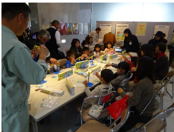
天びん作製コーナー