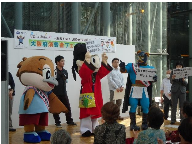
ステージコーナー