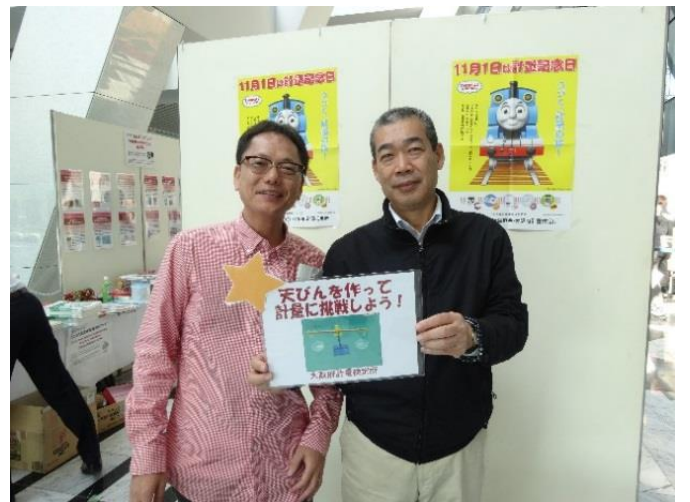
大阪府計量協会 職員