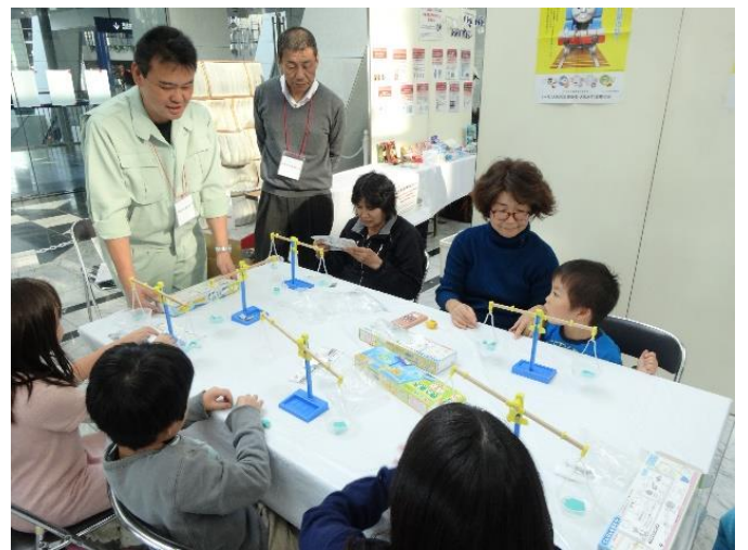
手作り・あそびコーナー