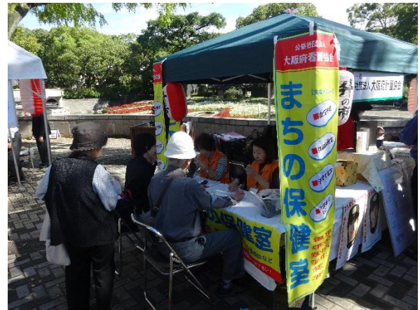
大阪府看護協会の健康相談コーナー