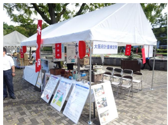
大阪府計量検定所コーナー