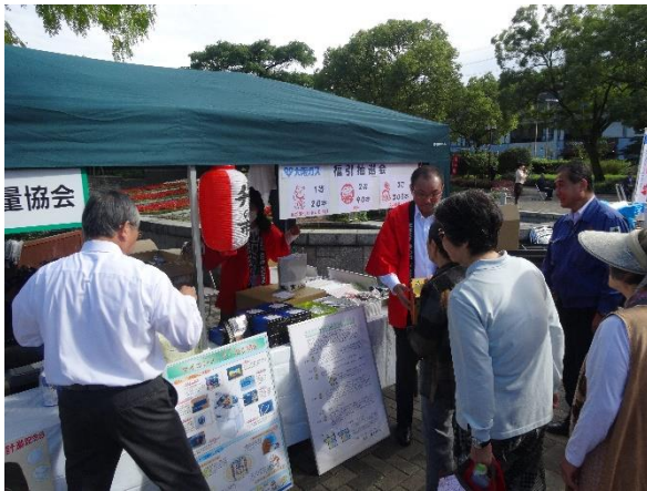
大阪ガス(株)の展示コーナー

大阪府計量協会も升の市実行委員会及び大阪府計量検定所と協力して、パネル展示、体組成計体験コーナー及び健康相談などのイベントに協力いたしました。