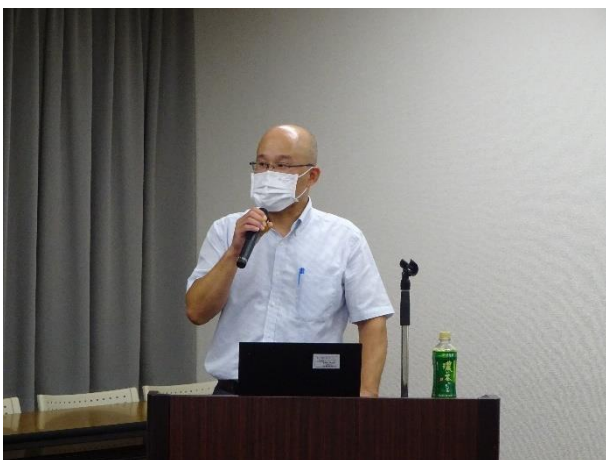
オムロンヘルスケア株式様の講演風景