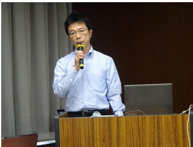
溝口様の講演風景